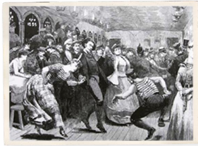
Joyeux Bercy – guinguette

Négociants, clients, ouvriers, artistes, tel le peintre Daumier, s'y retrouvent, ainsi que les canotiers. En effet, les jeunes gens, garçons et filles de toutes conditions viennent s'y encanailler et ramer le long de la Seine, habillés en marins d'opérette ou coiffés d'un chapeau de paille. Ils donneront naissance à l'un des symboles de la vie parisienne, connu dans le monde entier.