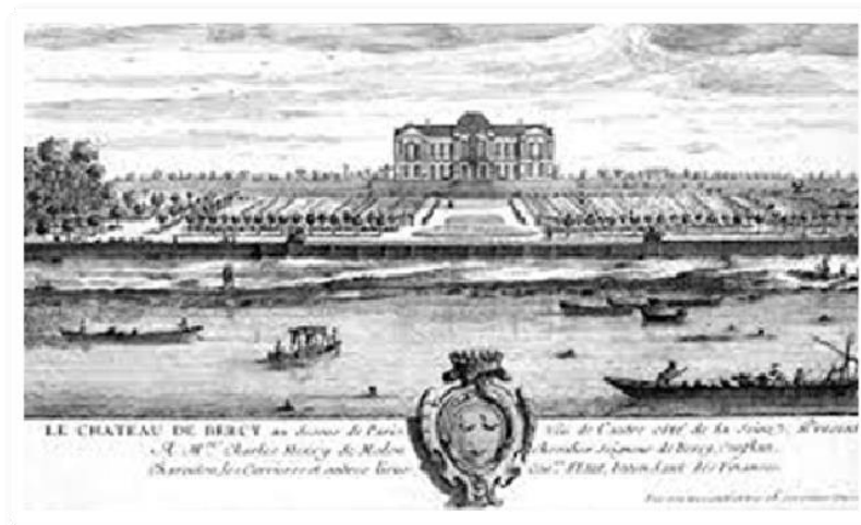
Château de Bercy

Puis, en 1172, une seigneurie naissante, dite la “Grange de Bercix”, l'évoque une seconde fois. Le terme « Bercy » que l'on emploie aujourd'hui apparaît en 1415, il s'agit de la « seigneurie de Bercy », appartenant à la famille de Montmorency.